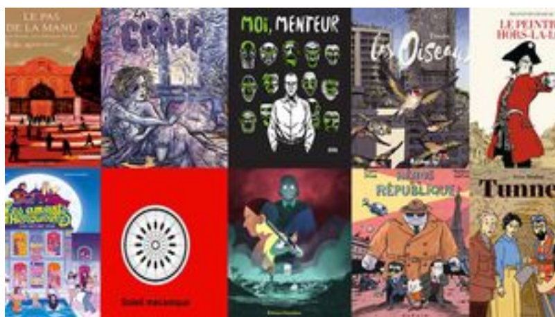
À lire - CULTUREConfinement : dix bandes dessinées et plus pour s'évader

s'est fait connaître en France avec la parution de son diptyque autobiographique : L'Art de voler , (2011) consacré à son père et L'Aile brisée (2016) consacré à sa mère.