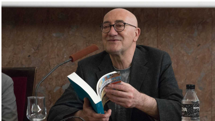
Ilustración 1 El guionista Antonio Altarriba

Si es difícil para un autor consagrado publicar sus cómics en el actual mercado español imaginaos para un dibujante novel. Esa es la principal razón por la que nace la fundación El arte de volar . Si el nombre os suena es porque detrás está Antonio Altarriba (Zaragoza, 1952), guionista de esa obra maestra del mismo título, dibujada por Kim, que consiguió el Premio Nacional de Cómic en 2010.