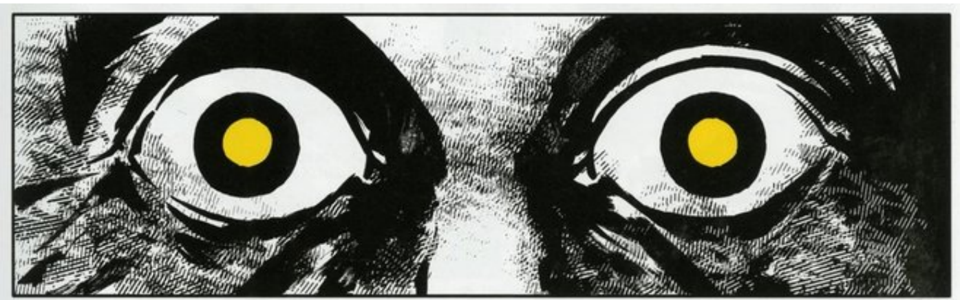
Viñeta de 'Yo, loco'