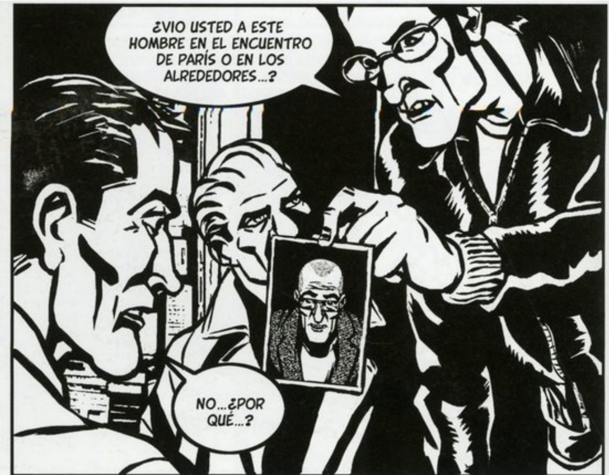
Viñeta de 'Yo, loco', con un guiño a 'Yo, aesino' en la foto, que tiene el rostro del guionista / ALTARRIBA Y KEKO

"A las farmacéuticas no les interesa invertir en enfermedades raras porque eso no les da suficientes clientes. No ocultan que en su balanza priman los beneficios. Porque si curan a la humanidad su industria se viene abajo. Y muchos de los expertos que deciden los nuevos trastornos cobran de laboratorios por encargos diversos", asegura antes de contar el agradecimiento de un lector, con el libro apenas llegado a librerías. "Me decía que lleva 10 años tomando 10 pastillas diarias de distintos medicamentos para un 'trastorno inespecífico de la personalidad'. No saben lo que le pasa pero le medican".