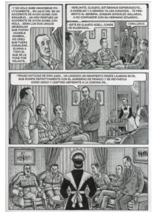
Petra, testigo de excepción

El ala rota es la otra cara de El arte de volar (Premio Nacional de cómic 2010), dos obras que forman un díptico donde los autores, Antonio Altarriba y Kim, repasan la historia política española del siglo XX —la caída de la monarquía, la segunda república, la guerra civil, la dictadura de Franco, el exilio, la II guerra mundial y el retorno del exilio— a través de las vivencias de sus dos protagonistas.