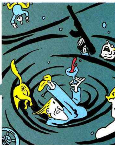
DICK TALON TOUCHE LE FOND DE WILLEM / Les requins Marteaux

L'Art du crime T.1 par Omeyer et Berlion Éditions Glénat. Voir critique page 75